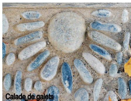
Calade de galets

TERRE HISTOIRE COEUR DE VILLAGE Vielles - Aure