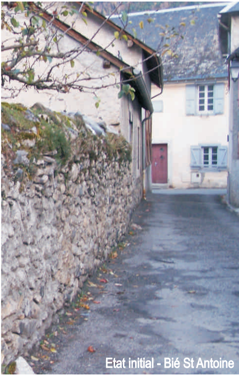
Etat initial - Bié St Antoine