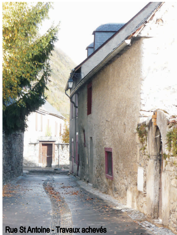
Rue St Antoine - Travaux achevés