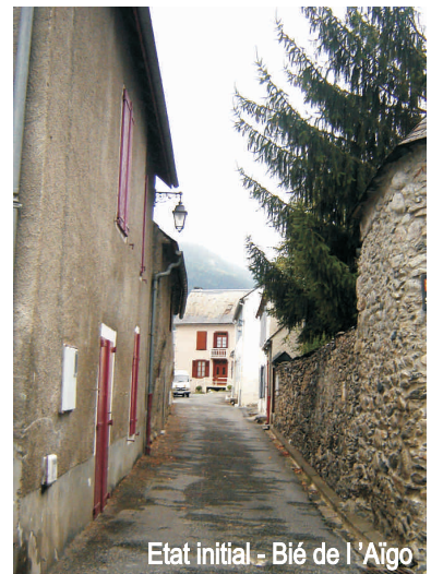
Etat initial - Bié de l'Aïgo