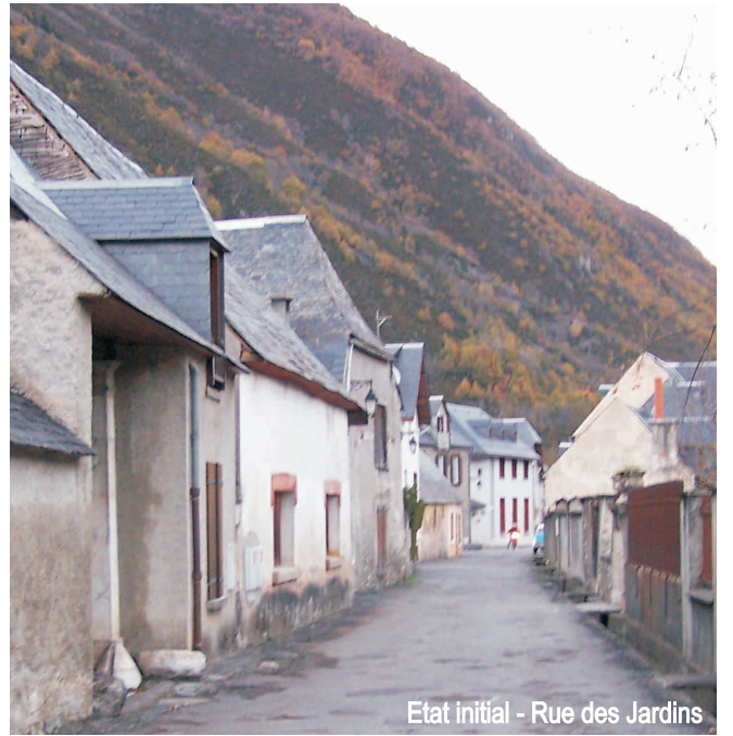
Etat initial - Rue des Jardins