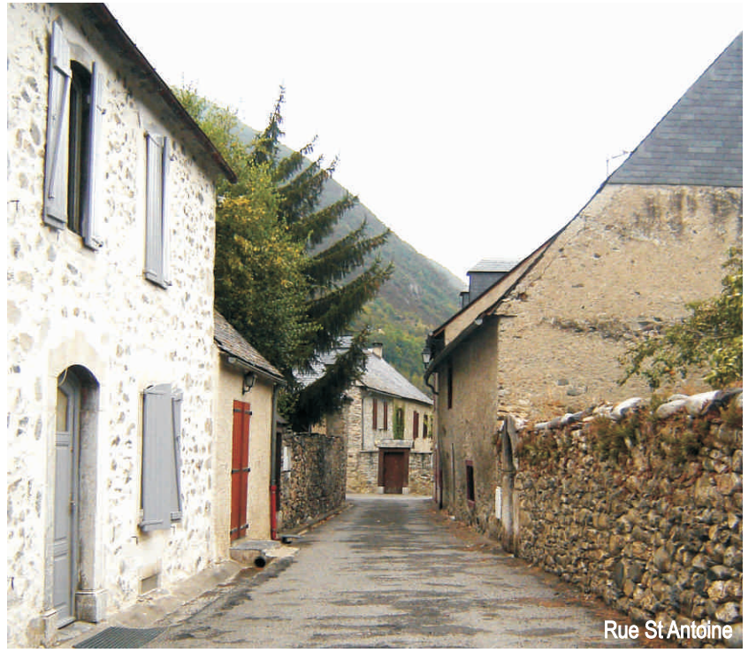
Rue St Antoine