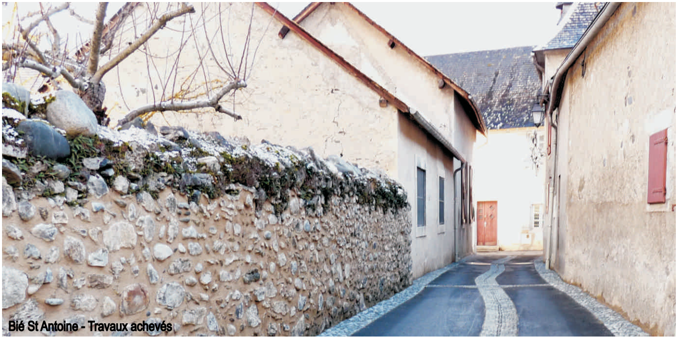
Bié St Antoine - Travaux achevés