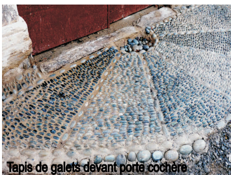
Tapis de galets devant porte cochère