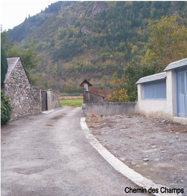
Chemin des Champs